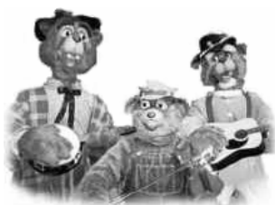
Les ours musiciens selon Sally

Cette entreprise de Jacksonville (Floride, USA) a connu des débuts modestes. Mais elle pourrait bien devenir la référence en matière de dark rides interactifs clés en main.