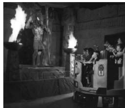
Challenge of Tutankhamon