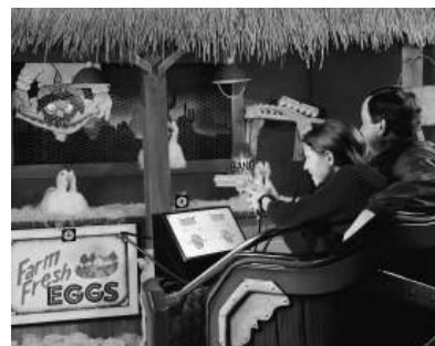
The Great Pistolero Roundup

Cette méthode de travail permet de proposer sur catalogue des dark rides interactifs haut de gamme à prix abordables pour les parcs régionaux : Sally Corp. a trouvé une niche dans l'industrie des loisirs.