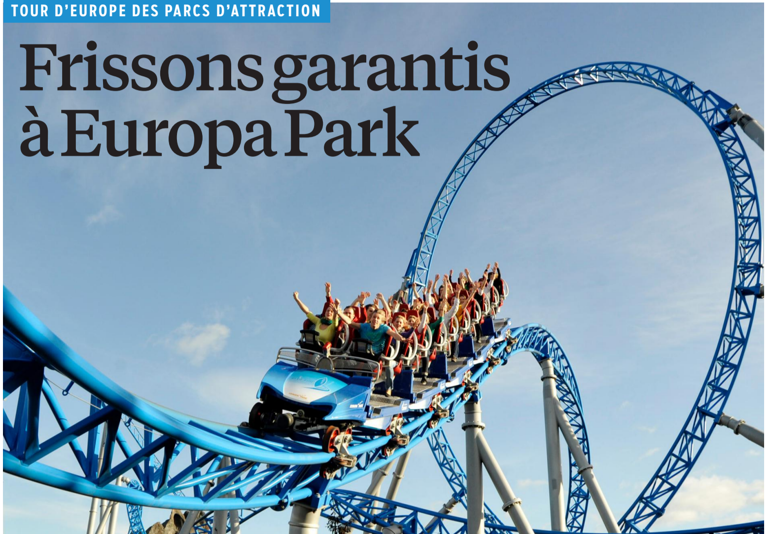
Sur ses 95 ha de superficie, le parc d'attractions compte pas moins de dix roller coasters. (Prod.)

Vu d'en bas, le Silver Star, une des attractions star de Europa Park (Allemagne), a de quoi décourager les plus courageux. Deuxième plus haut et plus rapide parcours de montagnes russe d'Europe, il culmine à 73 m de haut. Soit l'équivalent d'un immeuble de 23 étages ! Une fois dans le wagon, la lente ascension (une minute !) de la pente vertigineuse vous fait immédiatement regretter de ne pas vous être dégonflé. Et faire une prière ne sert plus à rien... Ensuite, tout va très vite. Au total, trois minutes de pur plaisir pour les millions de visiteurs qui s'y risquent chaque année.