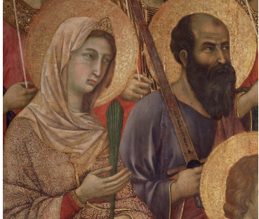
Sainte Catherine d'Alexandrie et saint Paul.

Être ou ne pas être en odeur de sainteté. Si l'on n'y est plus, ça sent le roussi. Avoir bonne ou mauvaise réputation, la perdre ou la retrouver. Mais les saints dégagent-ils une odeur divinement agréable ?